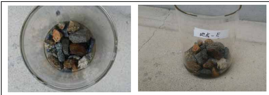
写真2.1.1 地点Eの捕集瓶に混入していた小石

地点E（事業実施区域周辺の民家近傍）については、降下ばいじん捕集瓶を回収する際（平成28年1月29日）に小石が混入していたため、分析の対象から除外した（小石が投入された時期は不明であるが、おそらく子供の悪戯であると推測される。故意に異物が混入された状態の試料では、正確な分析が困難であるため、本報告では分析の対象外とした。）。