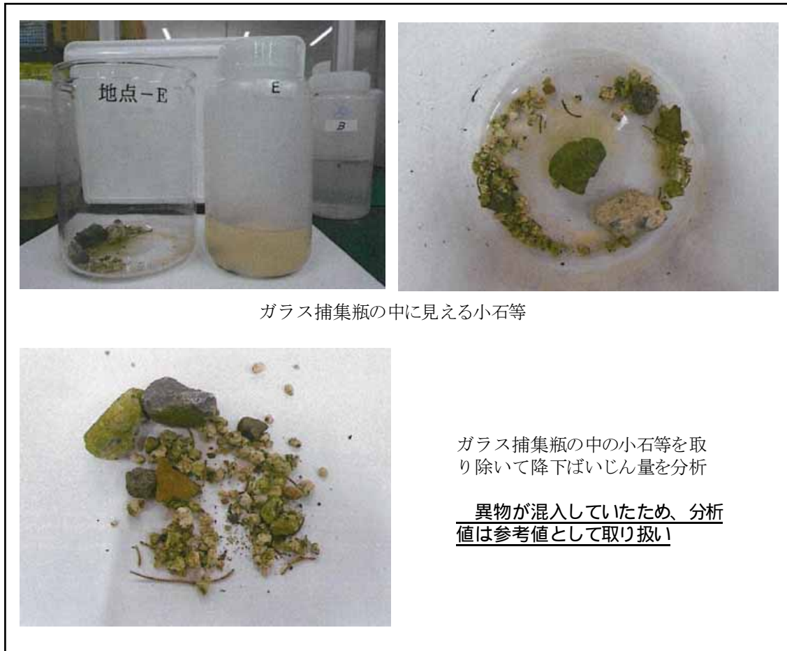
写真2.1.1 地点E（民家近傍 【香芝市穴虫1360-1】）における捕集瓶の中の様子