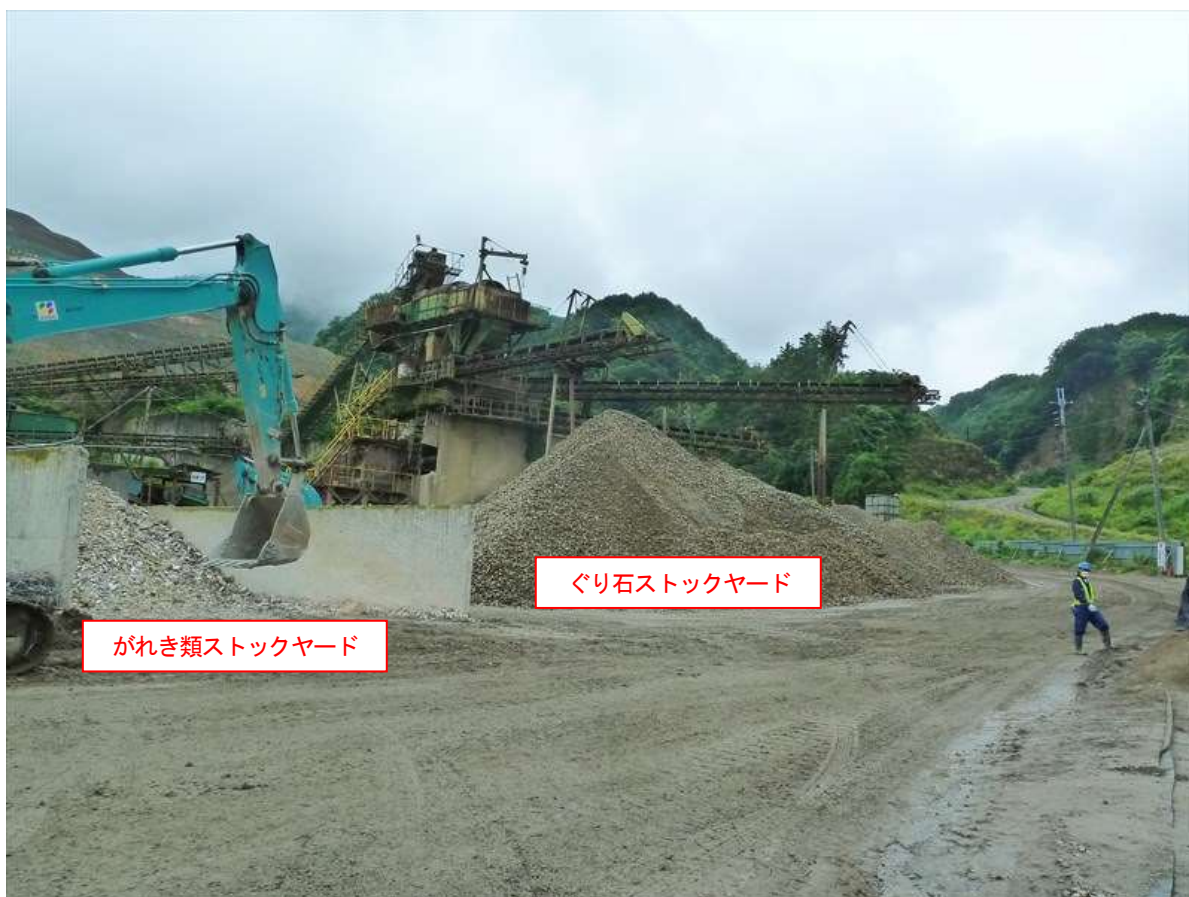
写真2. 2. 1 粉じん等調査地点と各ストックヤードの位置関係