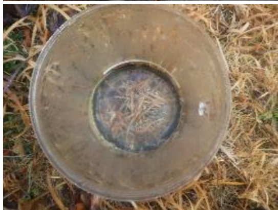
写真左上：調査地点全景 写真左下：分析試料（上から） 写真右上：分析試料（横から）