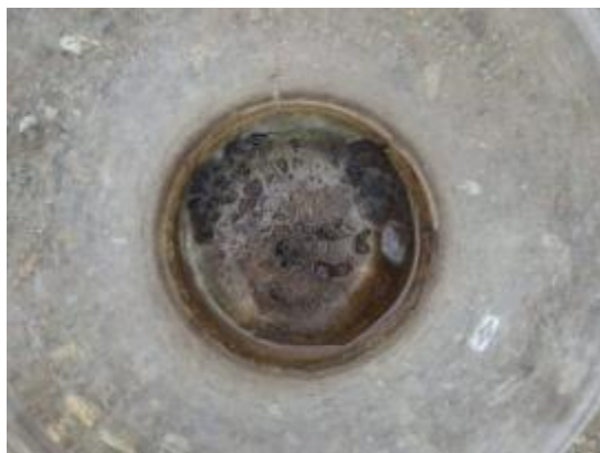
写真左上：調査地点全景 写真左下：分析試料（上から） 写真右上：分析試料（横から）