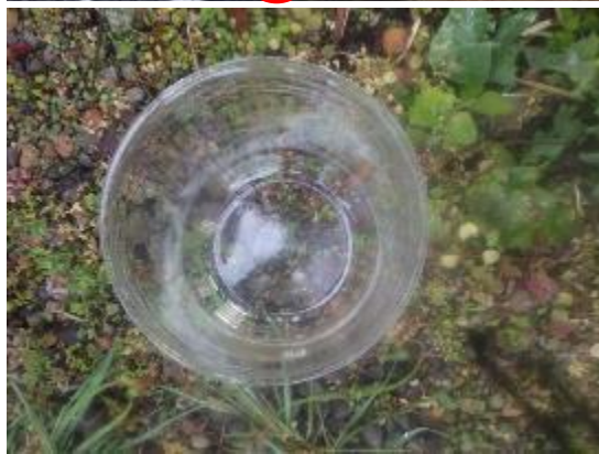
写真左上：調査地点全景 写真左下：分析試料（上から） 写真右上：分析試料（横から）