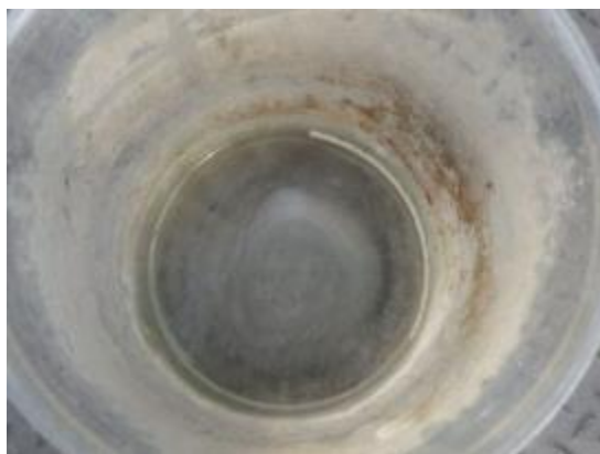
写真左上：調査地点全景 写真左下：分析試料（上から） 写真右上：分析試料（横から）